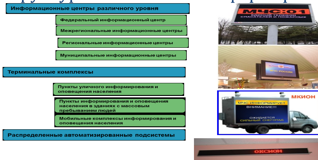
Рисунок 2. – Структурные элементы информирования и оповещения населения с помощью ОКСИОН

Информацию в области защиты населения и территорий от чрезвычайных ситуаций составляют сведения о прогнозируемых и возникших чрезвычайных ситуациях, их последствиях, а также сведения о радиационной, химической, медико-биологической, взрывной, пожарной и экологической безопасности на соответствующих территориях.