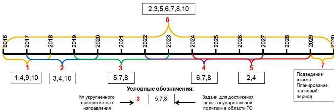
Рисунок 5. – Предлагаемое распределение укрупненных приоритетных направлений на временной шкале на примере реализации государственной политики Российской Федерации в области гражданской обороны до 2030 года

Заключение. Подводя итог, можно с уверенностью сказать, что роль гражданской обороны в системе обеспечения национальной безопасности государства очень велика и она является важной составляющей обороноспособности страны. В своей организации она взаимодействует со всеми составными элементами стратегических национальных приоритетов, входящих в систему обеспечения национальной безопасности.