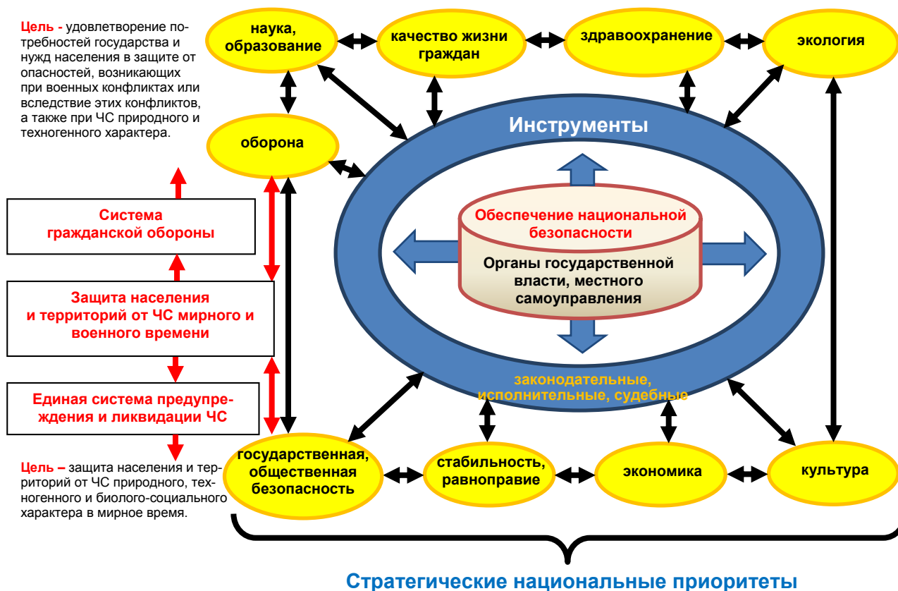
Рисунок 3. – Система обеспечения национальной безопасности государства

Обсуждение. Рассмотрим более подробно случай, когда создаются две системы. Система гражданской обороны фактически является резервной системой для единой системы предупреждения и ликвидации чрезвычайных ситуаций. Министром МЧС России Владимиром Пучковым определено, что: «Неотложной задачей органов государственной власти является придание гражданской обороне статуса федеральной государственной резервной системы».