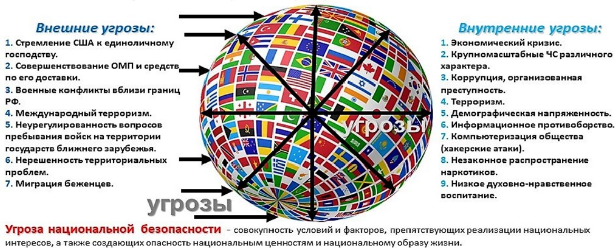
Рисунок 1. – Внешние и внутренние угрозы национальной безопасности государства

Военно-политическая обстановка - доминирующее состояние военно-политических отношений субъектов политики и их военных организаций на данный период времени. Важнейшим параметром военно-политической обстановки мирного времени является степень опасности развязывания войны (военного конфликта).