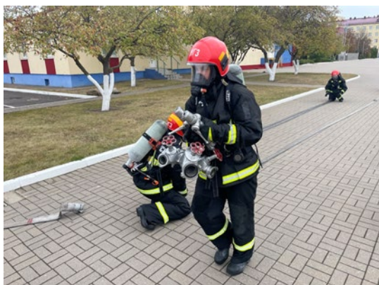
а – боевое развертывание и сбор ПТВ