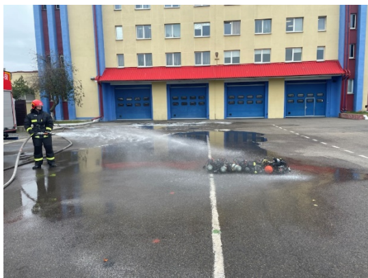
а – обливание АСВ