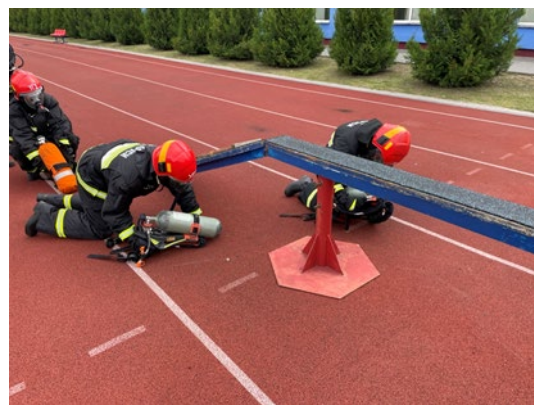
б – ориентирование на чистом воздухе