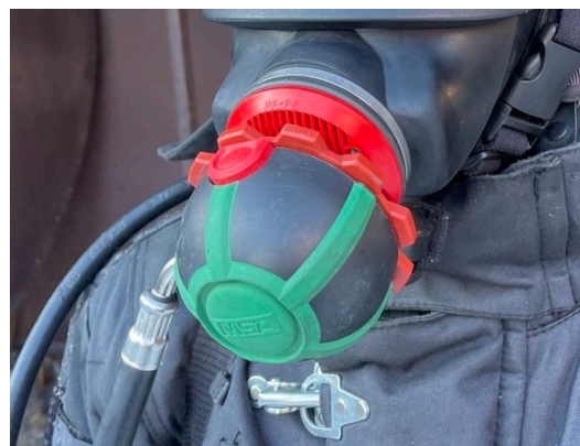
б – AutoMaXX-AE (MSA Safety Incorporated)