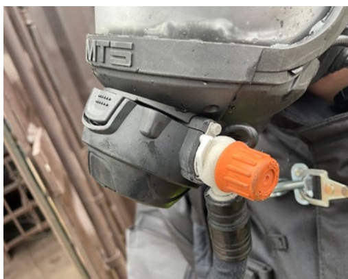
в – MTS RHZK