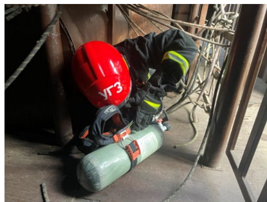
г – работа в МУТК