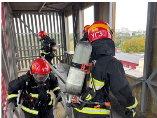
в – подъем и спуск по лестничным маршам