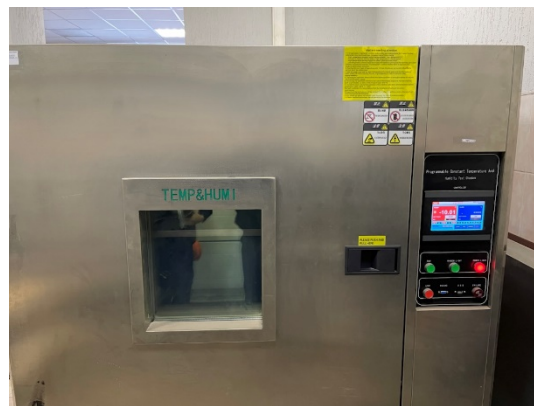
б – низкотемпературное кондиционирование