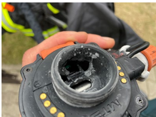
а – внешний вид

В ходе исследования было зафиксировано 7 случаев полного отказа – это 0,26 % от общего количества включений (2700 раз) при 90 000 мин общей наработки испытываемых АСВ. Из них 4 случая, связанных с обледенением клапана ЛА, произошли исключительно при выполнении упражнений в АСВ MTS RHZK Series после обливания водой. Остальные 3 – единичные случаи: 1 – при работе в АСВ Drager PA94 Plus Basic (неконтролируемая постоянная подача воздуха), 2 – при работе в АСВ БДА-СЛ (невозможность совершения вдоха при наличии воздуха в баллоне) (рис. 6).