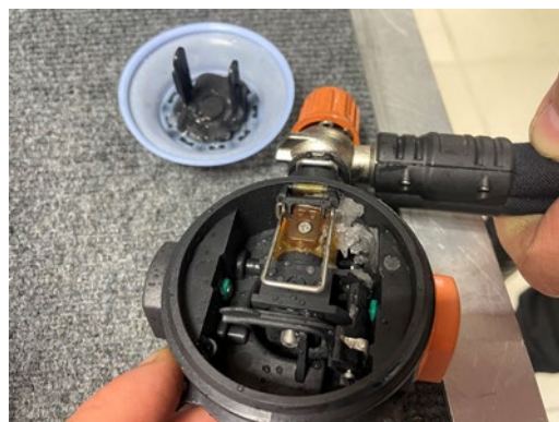
б – вид изнутри