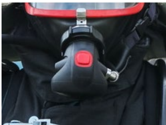
а – Drager Plus LDV P Short (PSS-A)

Существует проблема в отсутствии данных, описывающих динамику процесса отказа легочного автомата: от начального охлаждения и конденсации влаги до фазы обледенения и полной блокировки подачи воздуха. Особенно актуально это для конкретных моделей, применяемых в ОПЧС АСВ, при работе в условиях, комплексно моделирующих не только низкую температуру, но и основные сопутствующие факторы реального пожара: высокую влажность и прямое воздействие воды при тушении, а также высокую физическую нагрузку на спасателя.